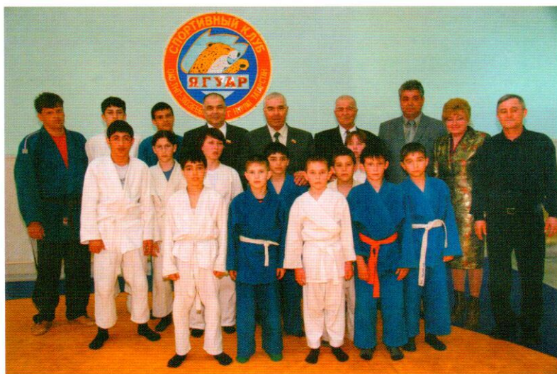
С дзюдоистами ДЮСШ СК «Ягур» г.Нурлат